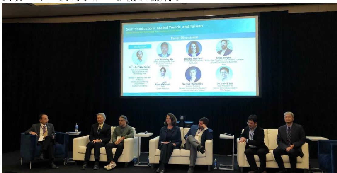
圖 3 Taiwan S&T Hub Conference 貴賓

為強化我國晶創計畫宣傳效果與國際鏈結，國科會於 1 月 8 日舉辦 Taiwan Science and Technology Hub Conference in CES 2024，本院國震中心台灣半導體研究中心、國家高速網路與計算中心、科技政策研究與資訊中心共同參加，推廣相關成果。