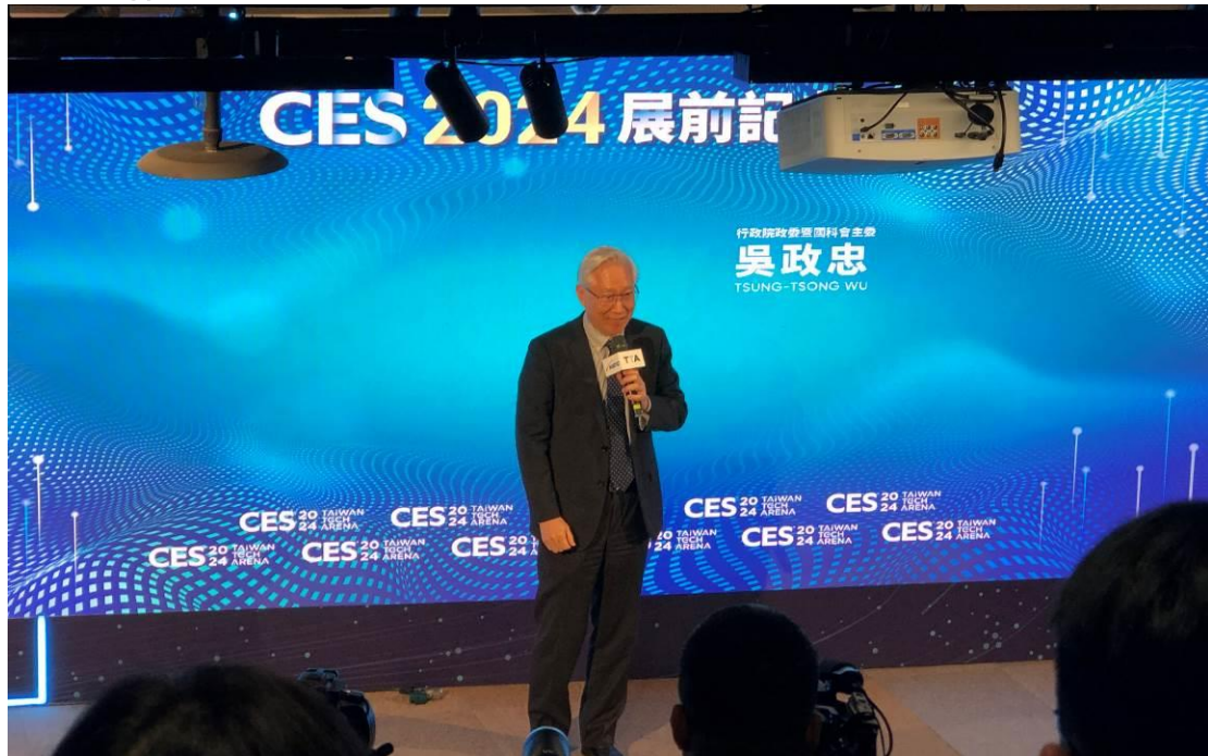
圖 2 國科會吳政忠致詞

為強化我國晶創計畫宣傳效果與國際鏈結，國科會於 1 月 8 日舉辦 Taiwan Science and Technology Hub Conference in CES 2024，本院國震中心台灣半導體研究中心、國家高速網路與計算中心、科技政策研究與資訊中心共同參加，推廣相關成果。