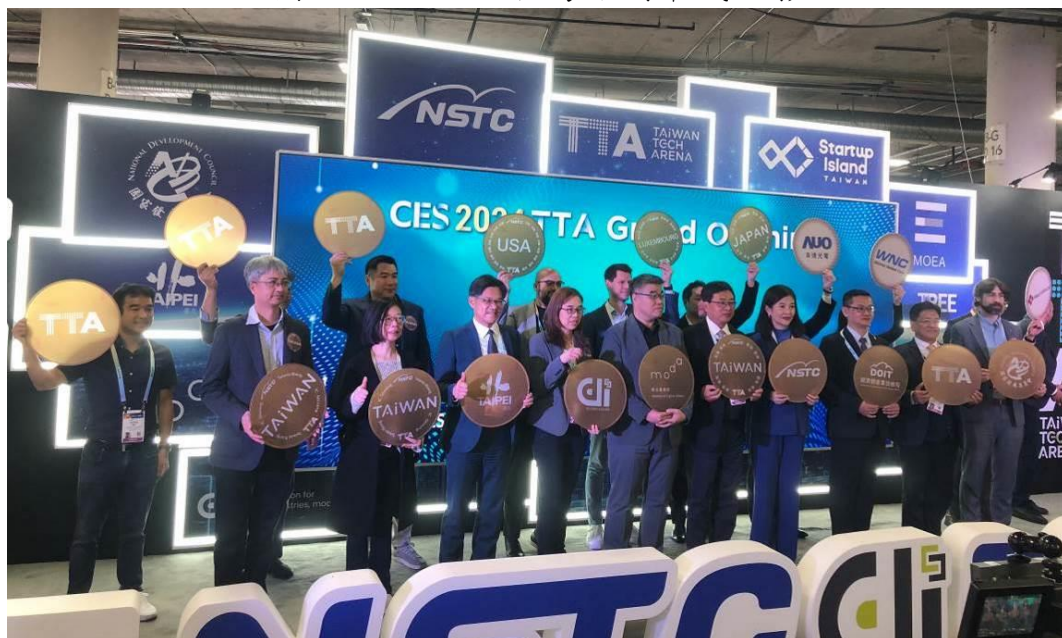
圖 6 CES 2024 開幕式貴賓合影