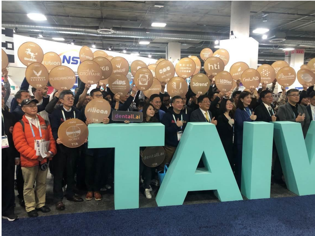
圖 5 CES 2024 台灣館開幕式合影